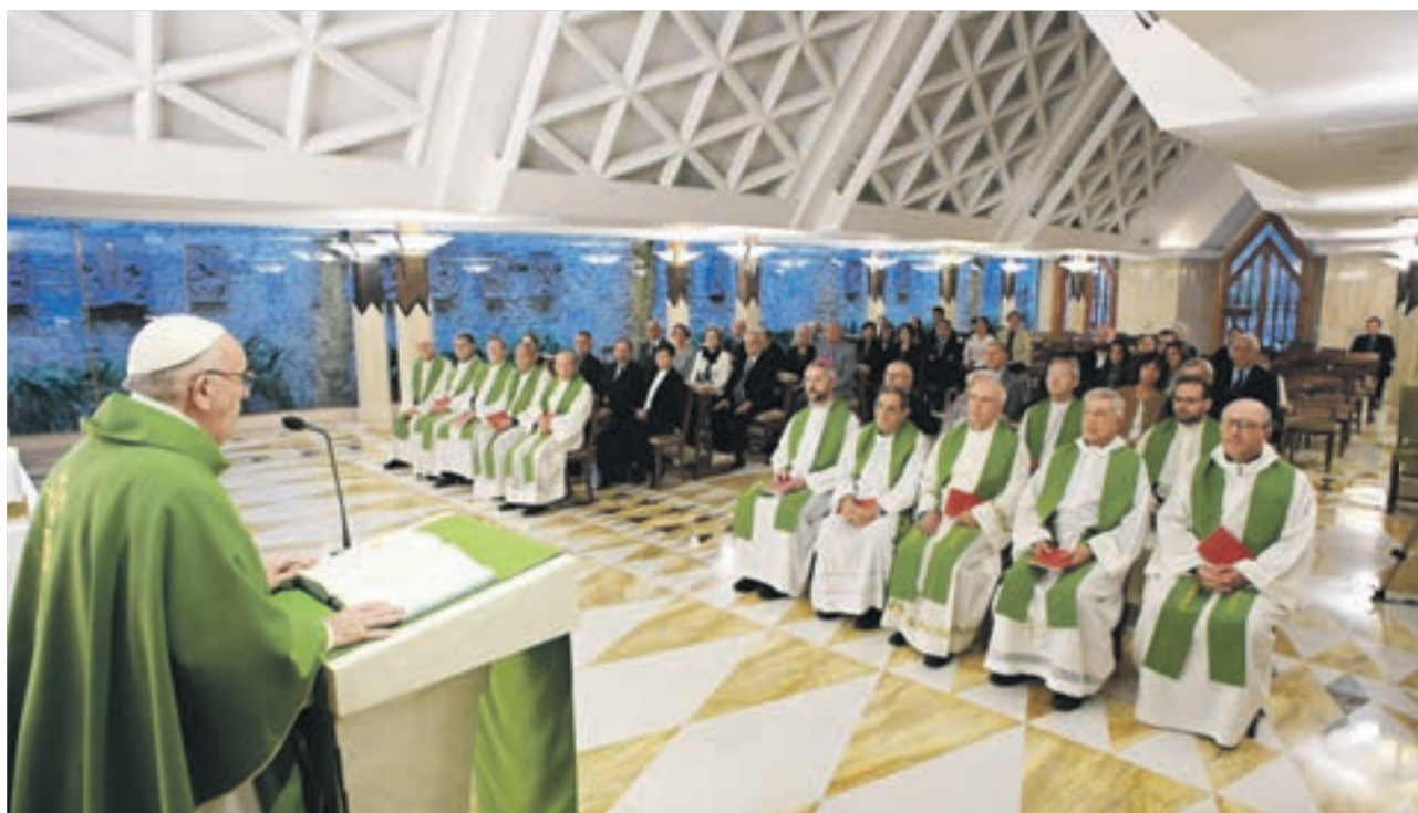
Paus Franciscus tijdens de ochtendmis in de kapel van Santa Marta. Tijdens zijn preek afgelopen maandagochtend leek Franciscus te reageren op de recente beschuldiging door aartsbisschop Carlo Maria Viganò.