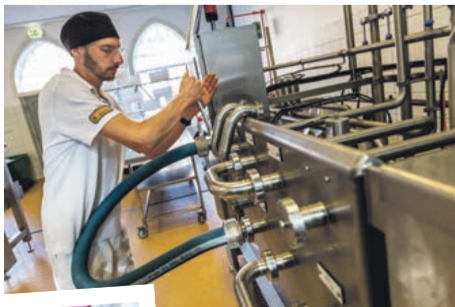
Links: De kaas wordt met veel liefde, zorg en toewijding gemaakt.

De cursieve citaten zijn afkomstig uit een blog dat broeder Isaac schreef over zijn leven als monnik in combinatie met zijn werk in de kaasmakerij. Info: www.trappistenkaas.nl