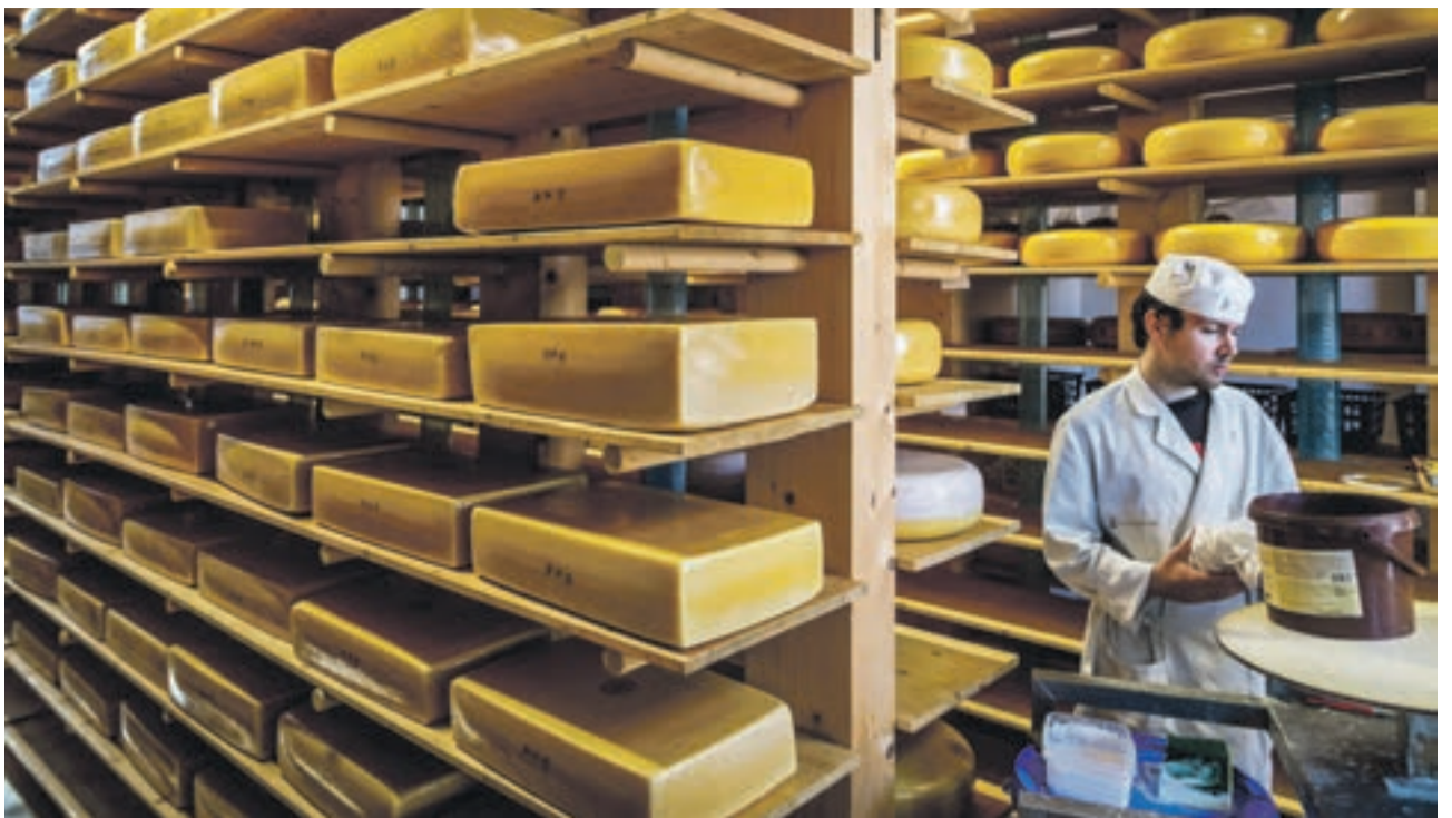
Wekelijks maken de monniken van tweeduizend liter geitenmelk en vierduizend liter koemelk zo'n zeshonderd kilo kaas.

leven in een ingewikkelde samenleving en bij het runnen van een bedrijf komt veel kijken. Ik noem bijvoorbeeld een milieueffectrapportage. Ook mijn gedachten dwalen aan het einde van de dag wel eens af naar mijn al dan niet afgewerkte agenda."